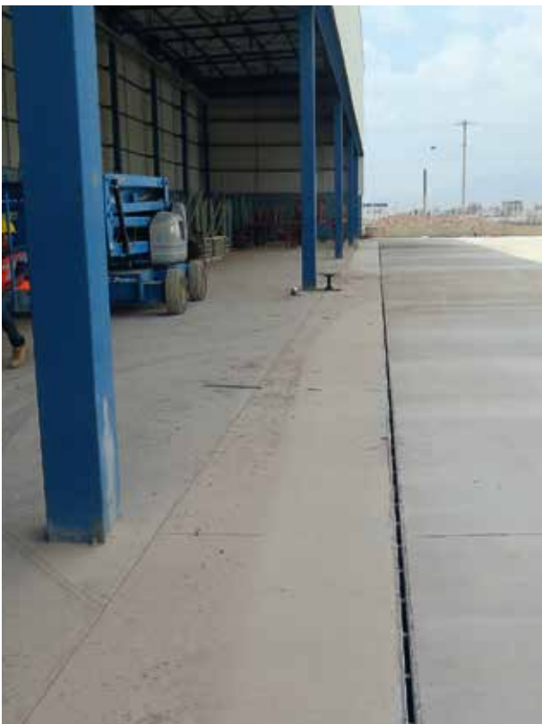
Planta Ronal, San Luis Potosí