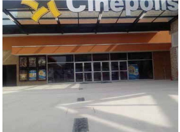
Planta Citadina, San Luis Potosí.