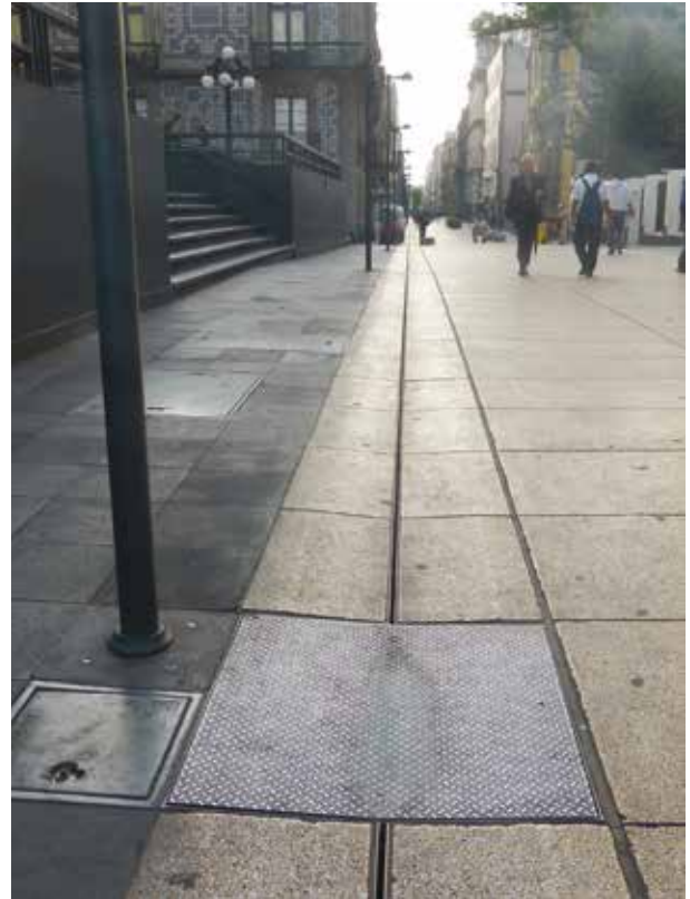
Centro Histórico, Ciudad de México.