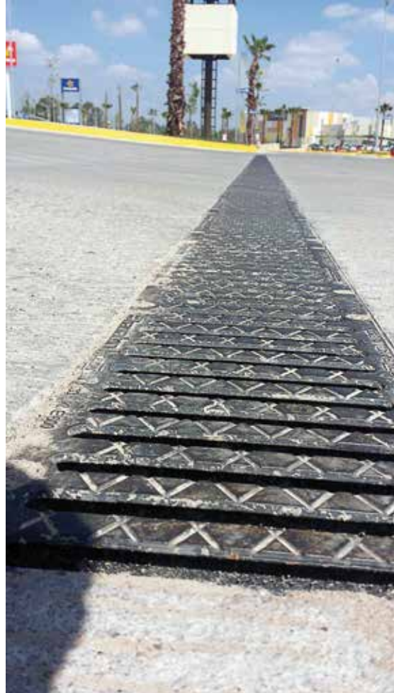
Plaza Adana, Aguascalientes, AGS.