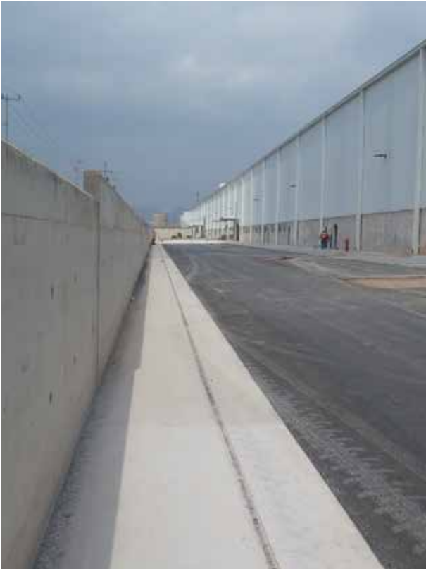
Planta Ronal, San Luis Potosí