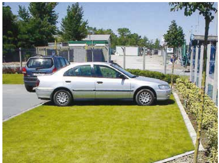
Estacionamiento de la compañía Rabomatik, Hungría