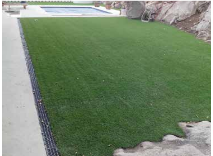
Departamento Residencial, San Luis Potosí, S.L.P.