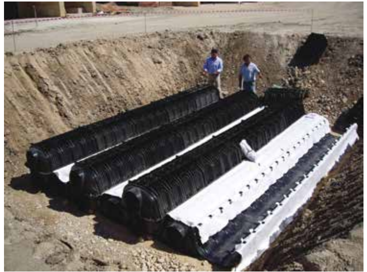
Sciaccia Verdura Golf Resort, Sicilia, Italia