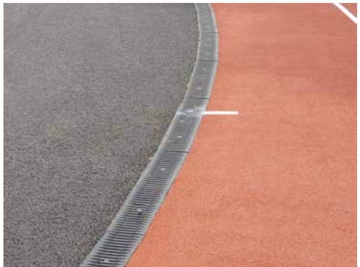
Campo deportivo Ernest Renan, Saint Herblain, Francia