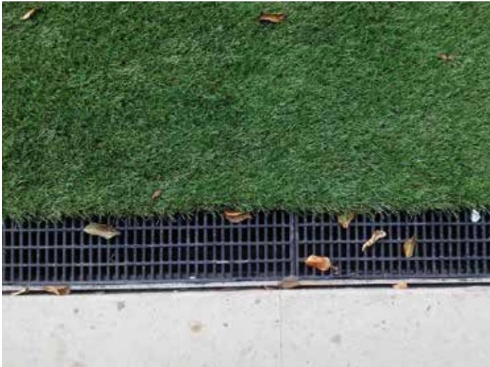
Vivienda Residencial, San Luis Potosí, S.L.P.