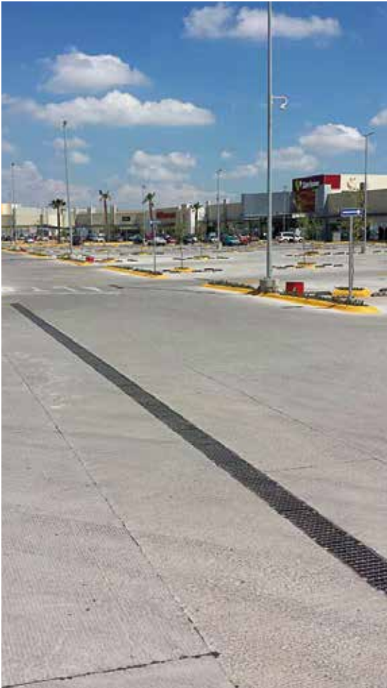
Plaza Adana, Aguascalientes, AGS.