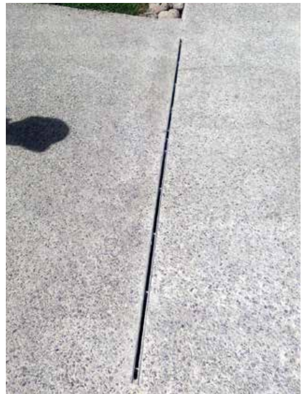
Planta Faurecia, San Luis Potosí