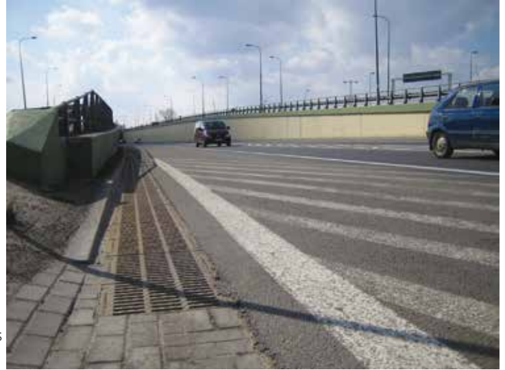
Túnel Białystok, Polonia