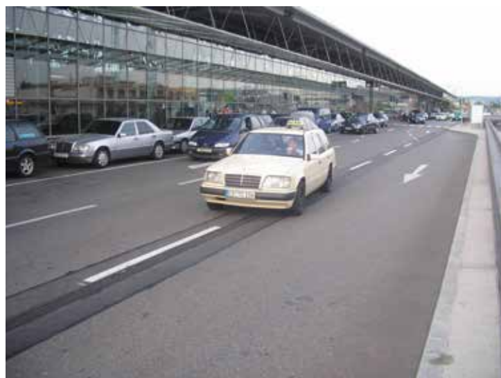
Aeropuerto de Stuttgart, Alemania