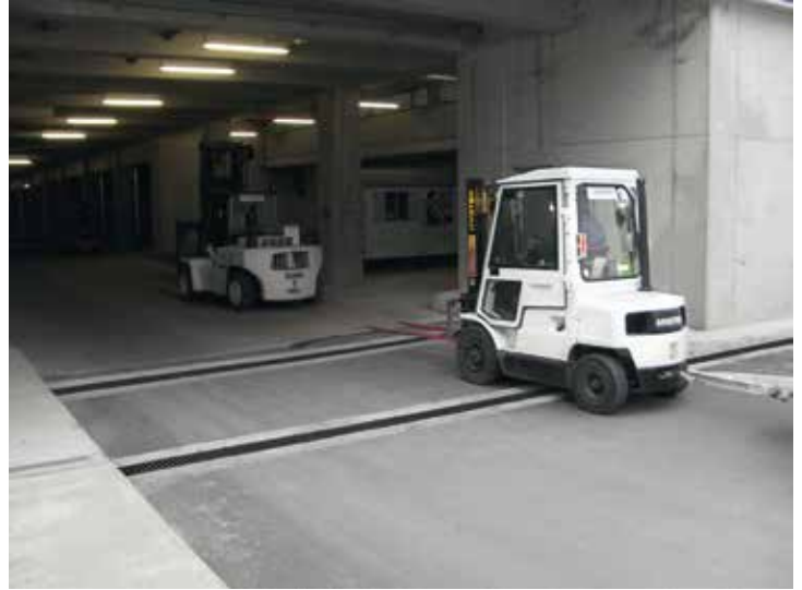
Centro Logístico, Hungría