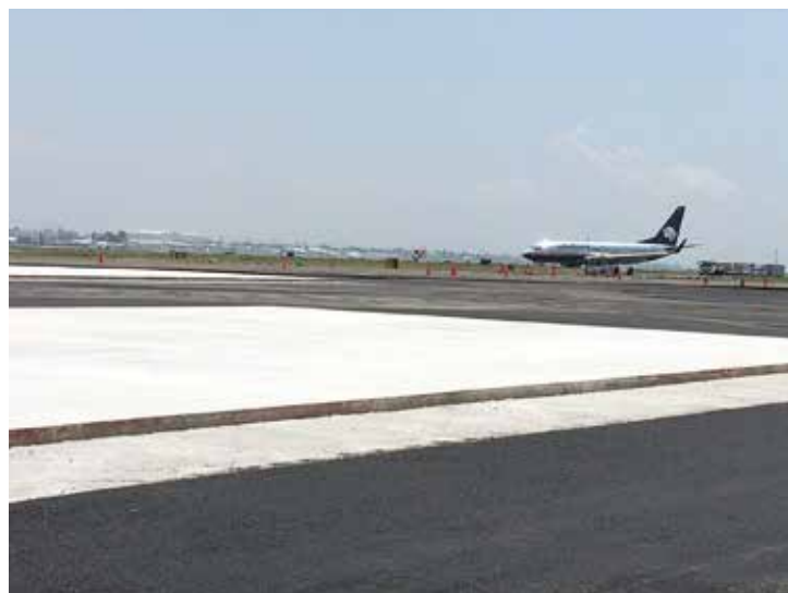
Aeropuerto de México, Ciudad de México