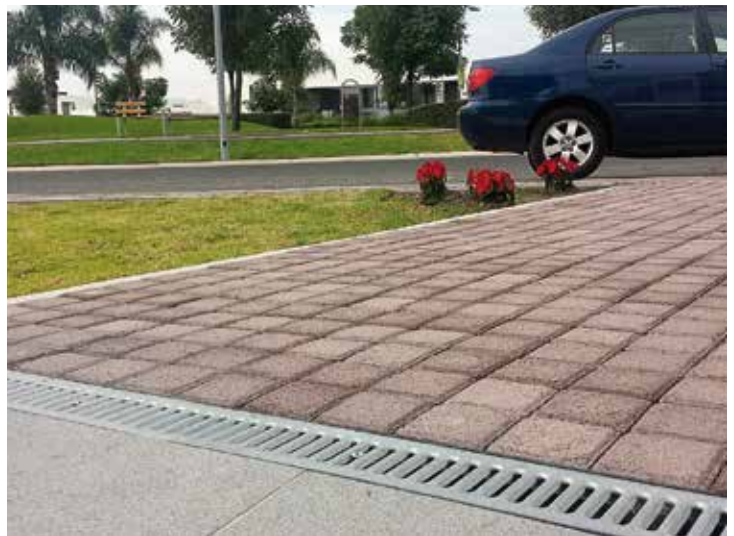
Oficinas Corporativas Juriquilla, Querétaro.