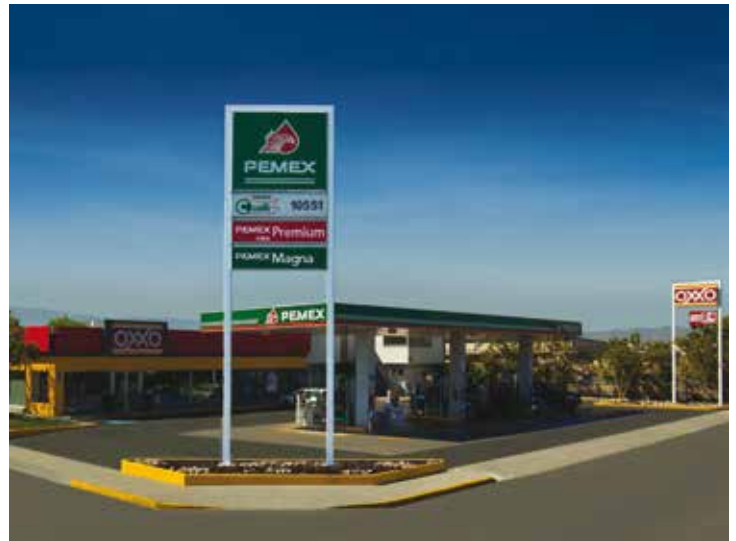
Gasolinera en San Luis Potosí, México